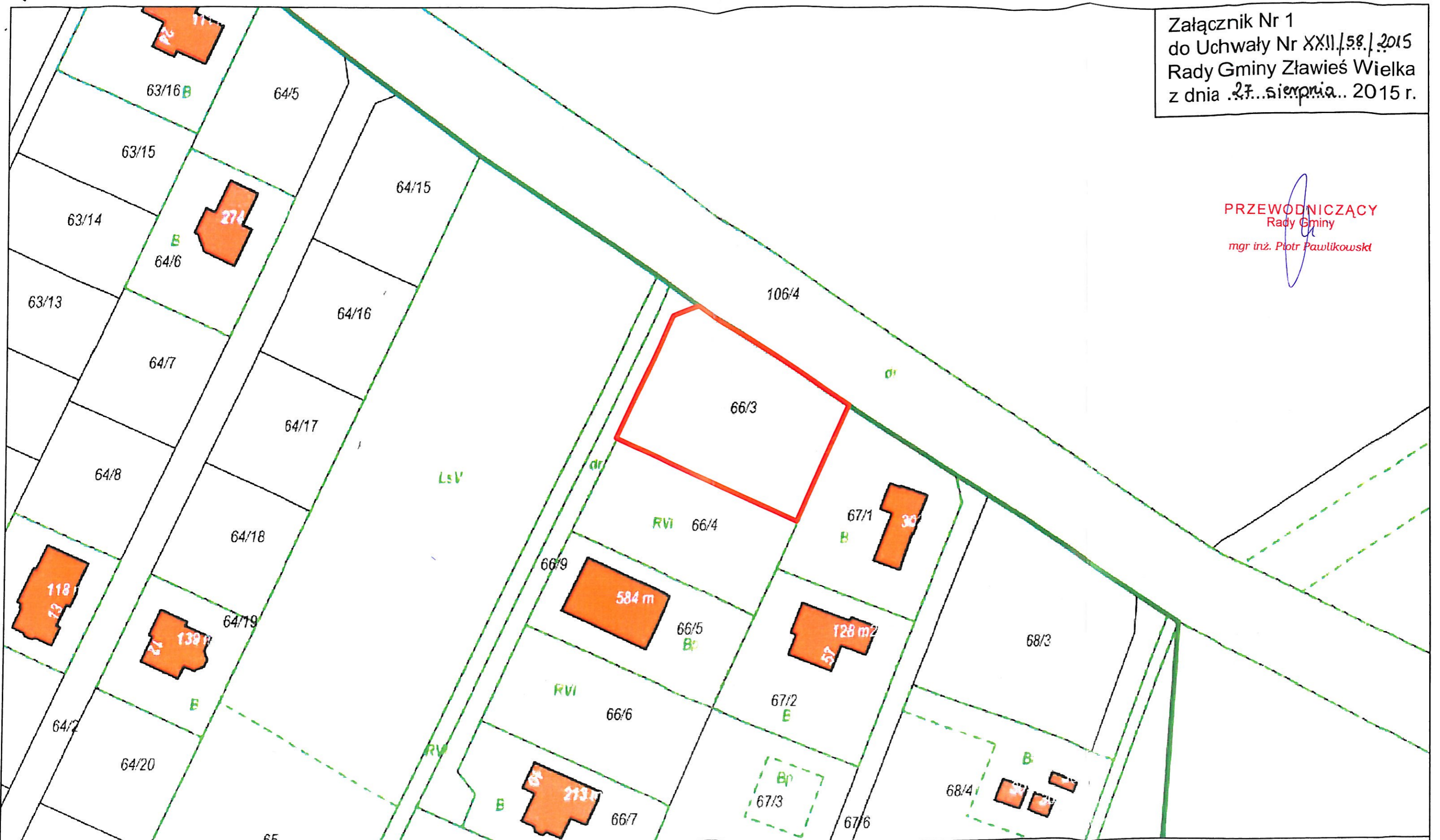
— GRANICA OPRACOWANIA MIEJSCOWEGO PLANU ZAGOSPODAROWANIA PRZESTRZENNEGO