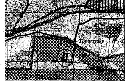
PLANSZA PODSTAWOWA 1 : 50 000